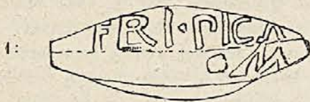
1 FERI·PICA M

4 de origine nihil traditur [in museo Kircheriano n. 229].