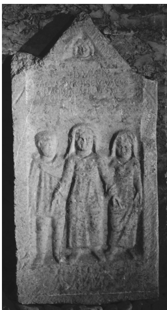
Dally (FWK 2009)

U. Ehmig - R. Haensch, ZPE 179, 2011, 284, Nr. 6.