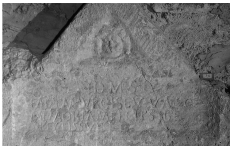
Matijević (FWK 2009)