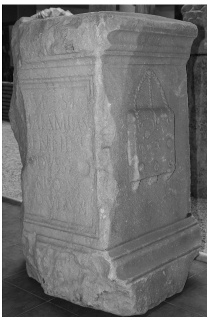
Matijević (FWK 2009)