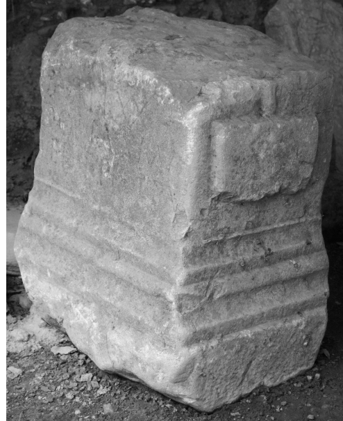
Daubner (FWK 2009)