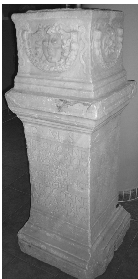
Fenn (FWK 2009)