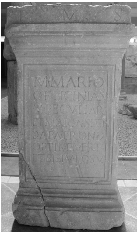
Matijević (FWK 2009)

S. Anamali - H. Ceka - É. Deniaux, Corpus des inscriptions latines d'Albanie (Rome 2009) 57, Nr. 60; Foto.