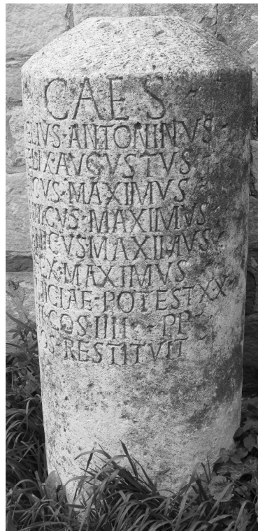
Daubner (FWK 2009) (Montage)