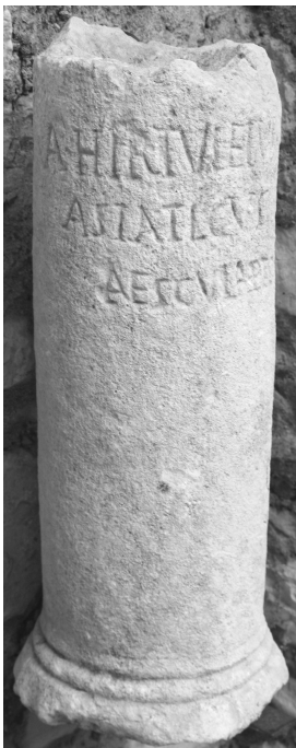
Matijević (FWK 2009)

S. Anamali - H. Ceka - É. Deniaux, Corpus des inscriptions latines d'Albanie (Rome 2009) 179–180, Nr. 241; Foto.